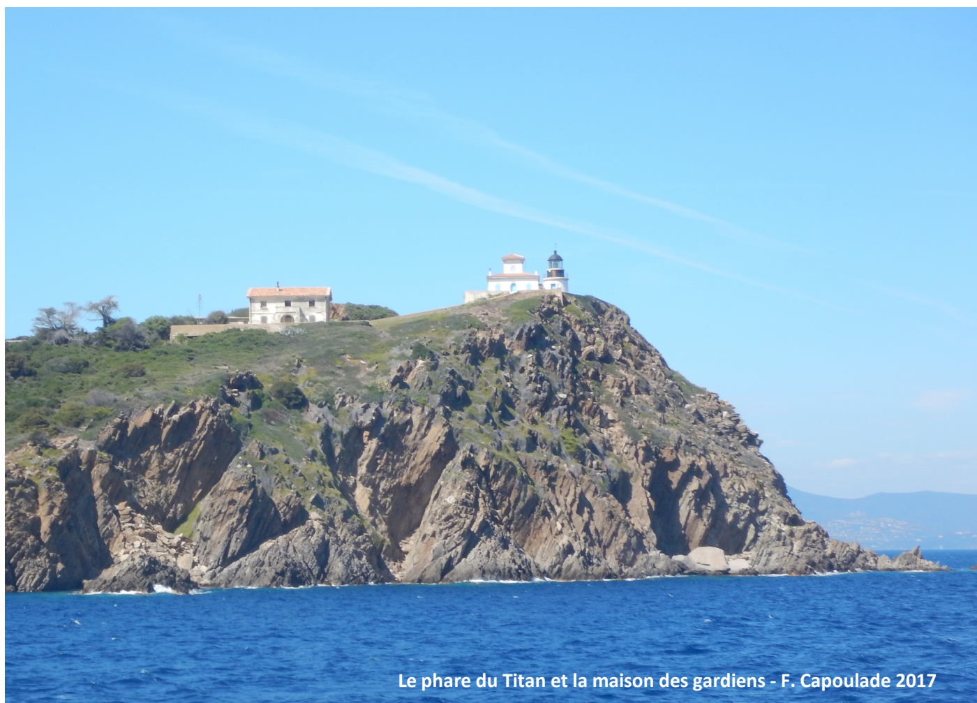
Le phare du Titan et la maison des gardiens - F. Capoulade 2017