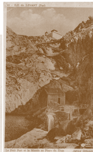
Cartes postales de l'Agence Officielle - Domaine naturiste d'Héliopolis - 1935

Le phare du Titan, pour bien des voyageurs, était le seul point de repère dans une nuit, un bras ami, qui, parfois, pouvait vous tirer hors de la mêlée des vagues. En visite en 1938 à Hyères, l'écrivain-voyageur Paul Morand écrit ainsi : “Les tirs de la marine, les incendies, les abandons successifs des essais de culture ont transformé l'île du Levant en désert, un désert que laboure le phare du Titan de sa grande lame que l'on voit monter de la mer à la pointe du jour, lorsqu'on a quitté Nice après dîner et qu'on a navigué doucement à six nœuds, bercé sur une mer apaisée par la nuit, au-dessus du feu de mât qui se balance parmi les étoiles” . Le Titan, grâce à ses gardiens, était donc cela : un reste de civilisation, un repère amical, synonyme de la bravoure éternelle des hommes de la mer.